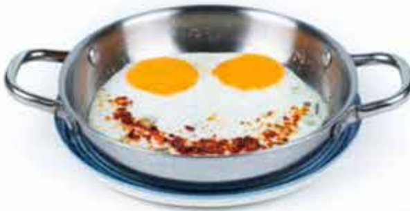
Sahanda Yumurta - 55,00