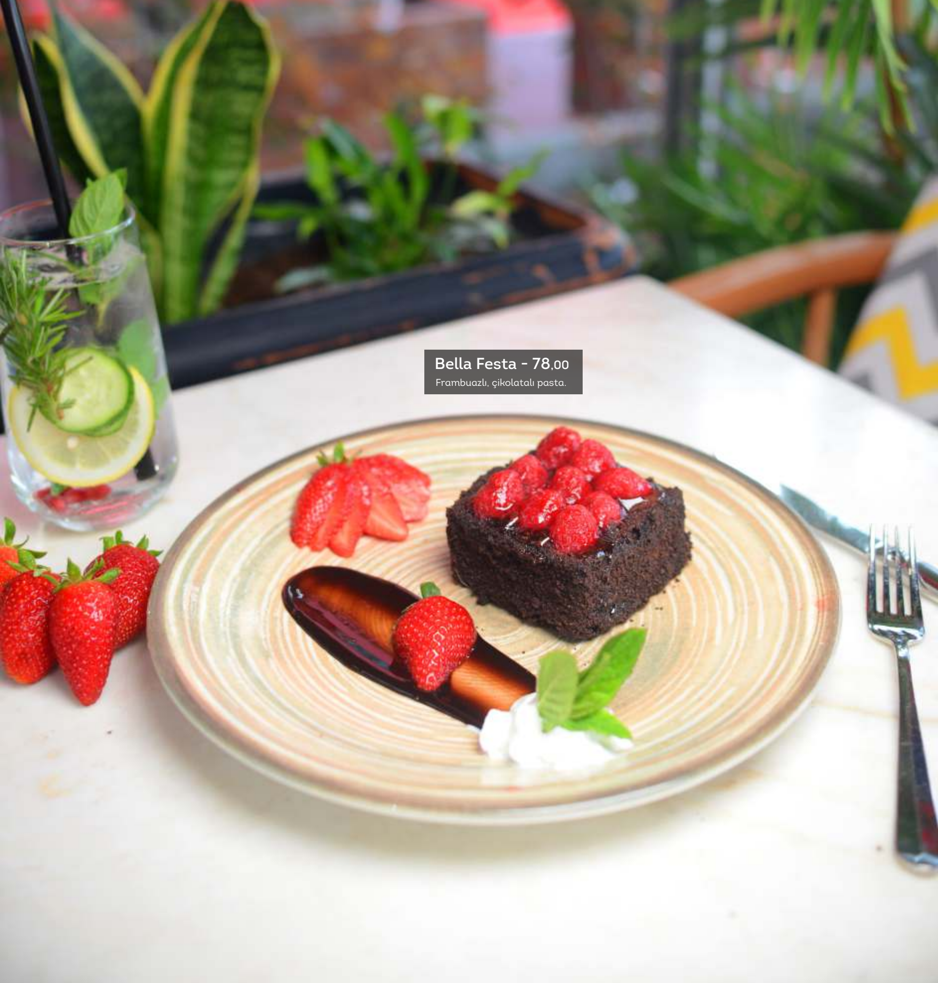
Bella Festa - 78,00 Frambuazlı, ikolatalı pasta.