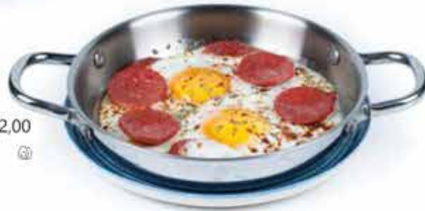
Sahanda Sucuklu Yumurta - 82,00