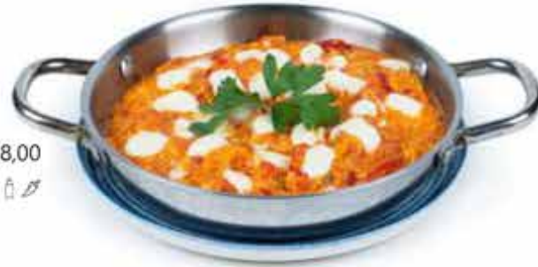
Menemen Ezine Peyirli - 78,00