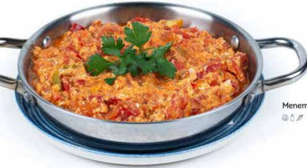
Menemen - 75,00